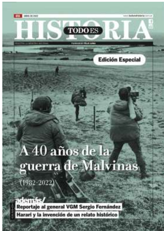
Número 651 (2022)