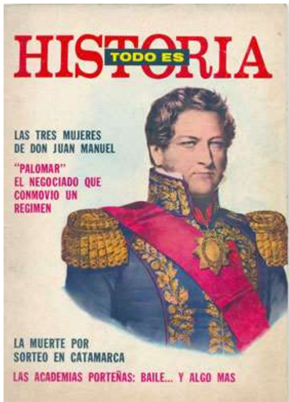
Número 1 (1967)